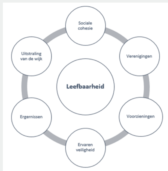
Figuur 2. Factoren die invloed hebben op leefbaarheid in Sanderbout

“Leefbaarheid is vooral veel plezier met elkaar te kunnen hebben, door met elkaar te kunnen praten. Geen geruzie in de wijk. Met elkaar met respect kunnen communiceren. Iets kunnen organiseren. Dat is een praatje maken op straat en genieten van andere mensen en de kinderen van anderen en samen genieten van de dagelijkse dingen.”